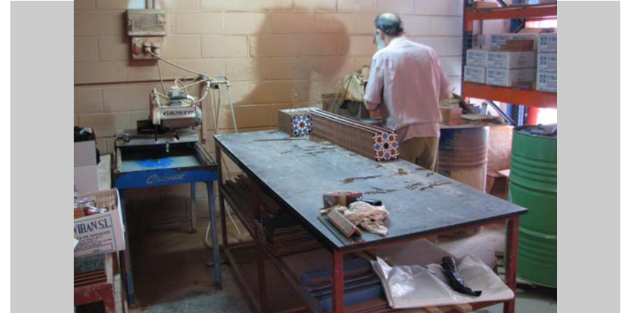
7 Zona cortado al agua