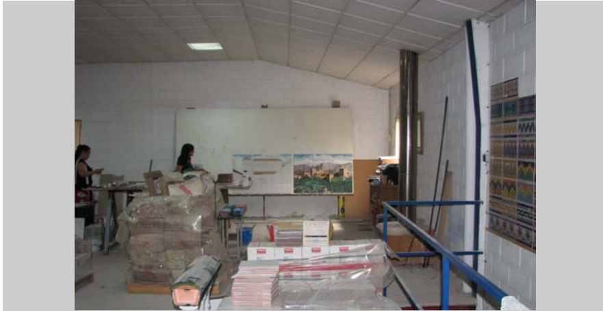
9 Planta superior. Zona pintado murales sobre azulejo

Nº FICHA C-13 REF. PLANO 07 REF. AUDIOVISUAL