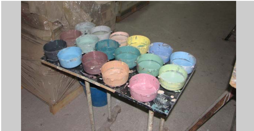
10 Pigmentos de elaboración propia