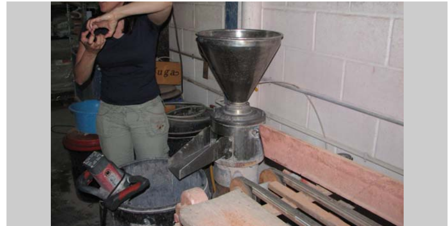
12 Molino esmaltes