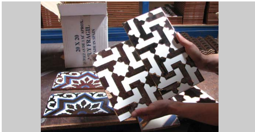
14 Azulejo histórico y su reproducción