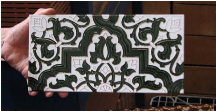
6 Azulejo en relieve terminado