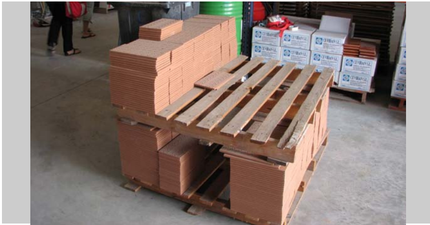
2 Palé bizcocho con relieve