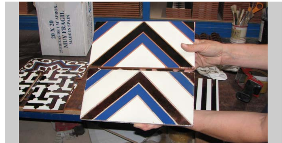
16 Azulejo histórico y su reproducción