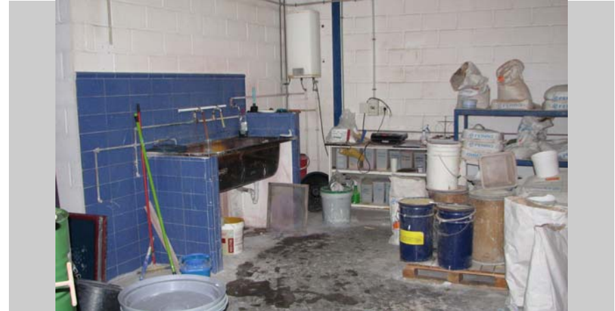
11 Zona elaboración esmaltes