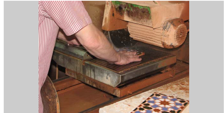
8 Cortado al agua