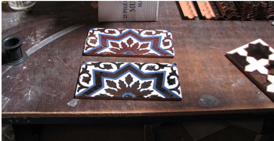
13 Azulejo histórico y su reproducción

Nº FICHA C-13 REF. PLANO 07 REF. AUDIOVISUAL