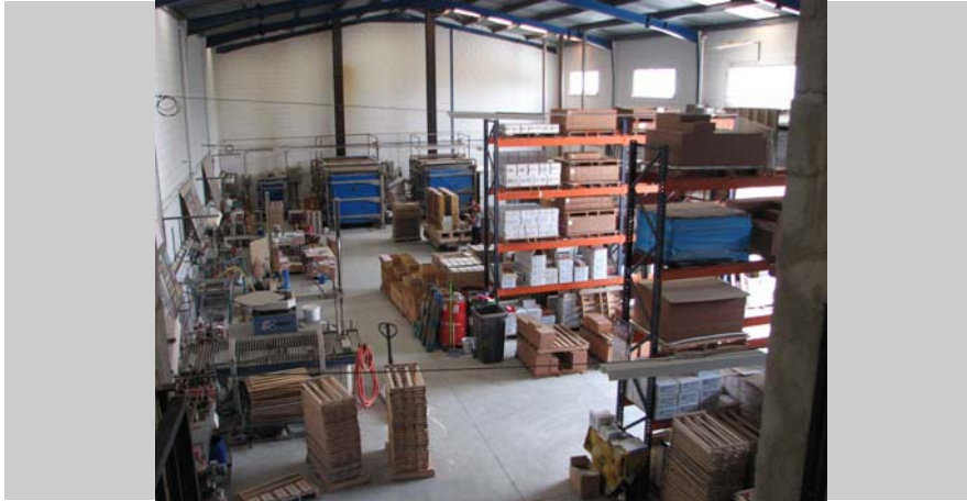
1 Interior nave, zona esmaltado, pintado, cortado al agua